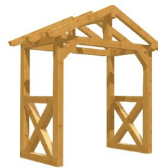
*^|^æ^Á^æ^}, æ á