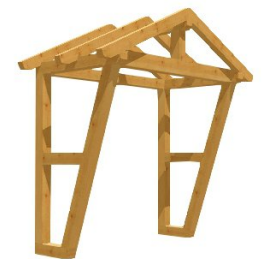
•&@è*^Á^æ^}, æ á