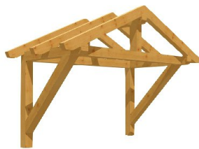
S[ ] -àæ á